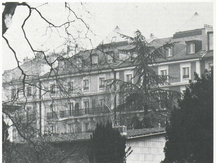
Rue des Rois: l'exemple existant (immeubles des numéros 7 et 9) qui permet d'imaginer la réhabilitation d'un «ensemble d'architecture identique» dans un quartier datant du début de notre siècle.