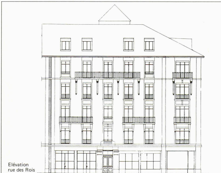
Élévation rue des Rois