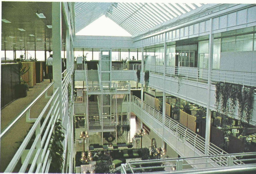
Fig. 14. — L'espace ouvert, élément essentiel du climat de travail souhaité par l'entreprise.

Une attention toute particulière a été vouée à la disposition des terminaux par rapport à l'éclairage naturel et artificiel. Pour la plupart, ils bénéficient d'une inclinaison réglable, afin d'éliminer tout éblouissement. Des écrans orangés sont