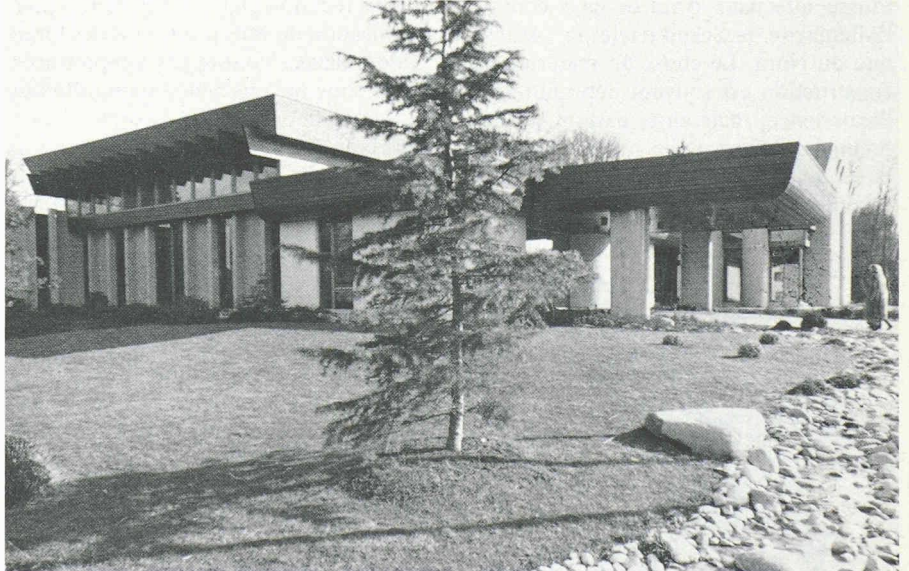
Les nouvelles conceptions architecturales et architectoniques se prêtent particulièrement bien à l'usage du bois. L'utilisation de ce matériau pour la structure et l'aménagement des constructions publiques — communes, écoles ou administrations — doit être encouragée afin de favoriser l'écoulement de cette matière première.

La lutte doit s'appliquer en priorité aux causes directes. Les connaissances scientifiques ne laissent plus aucun doute à ce sujet : la forêt ne retrouvera sa santé que lorsque la pollution atmosphérique aura diminué. Cette tâche n'incombe pas aux