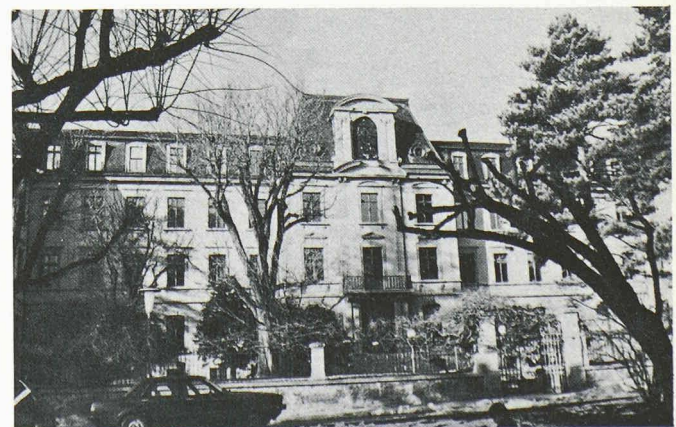
Le même immeuble après la rénovation et la transformation en Palais de Justice, en 1983.