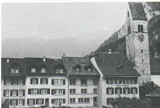
Vue partielle de la vieille ville d'Unterseen.