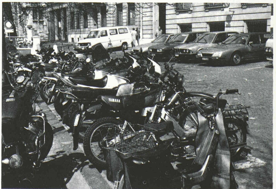
Engins inoffensifs pour l'environnement, selon M. Egli, parce qu'utiles (et tant pis pour le bruit et pour l'encombrement d'une artère aussi « protégée » par l'Art public : la Corratier, à Genève !).

Nous sommes face à deux rythmes en réalité totalement déphasés : en politique, il est impératif de présenter des résultats (ou au minimum un programme !) tous les quatre ans, alors que l'environnement est régi par des lois souvent à l'échelle du siècle. Cela explique pourquoi il ne faut pas que les décisions dans ce domaine finissent par être agendées sur le seul calendrier politique. Dans le cas du dépérissement des forêts,