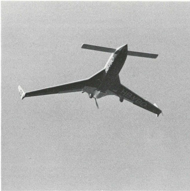
Fig. 1. — Le Rutan VariEze (ci-dessus).