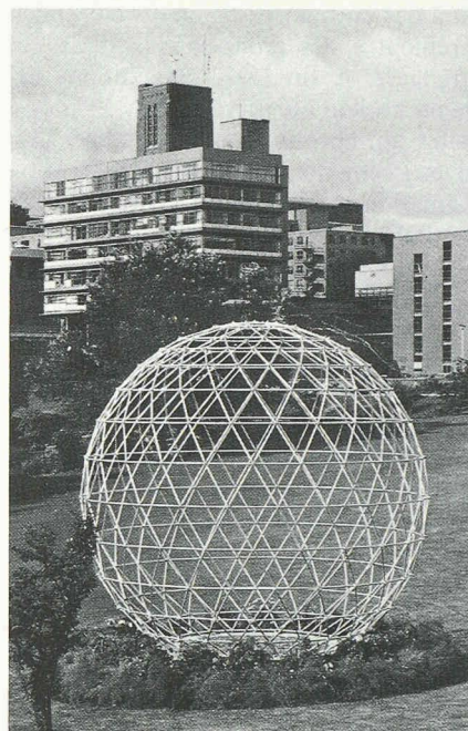
Fig. 1. — Université de Surrey, Guildford, Grande-Bretagne. Forme sculpturale en système Triodetic érigée à l'occasion de la 3 e Conférence internationale de structures spatiales.

Par ailleurs, chaque journée débutait par une séance commune, où des personnalités présentaient d'une manière générale l'un des sujets de la conférence.