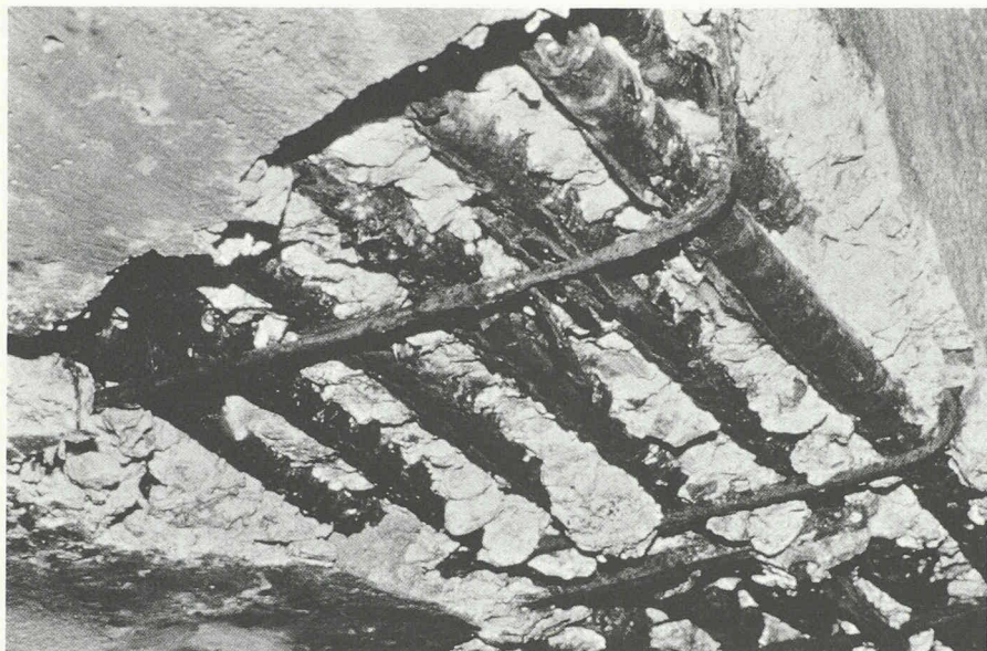
Corrosion prononcée de l'armature d'une poutre.

dans le béton, il est naturellement protégé (formation d'une couche de passivation) par l'alcalinité du milieu ambiant (pH eau incluse du béton > 12,5 ). Deux phénomènes peuvent entraîner la corrosion des armatures: la baisse du pH du béton ( < 10 ) par suite de la carbonatation ou la présence de substances agressives (ions chlorures essentiellement) pouvant détruire localement la couche passive.