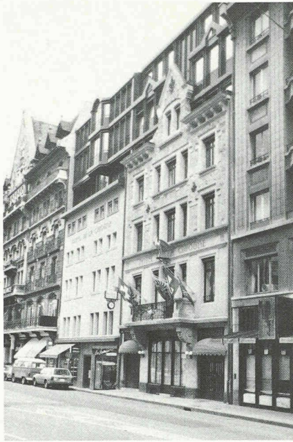
Fig. 7. — L'hôtel de la Cigogne à la place Longemalle.

démonstrative, la corniche et le départ de l'ancien toit étant conservés.