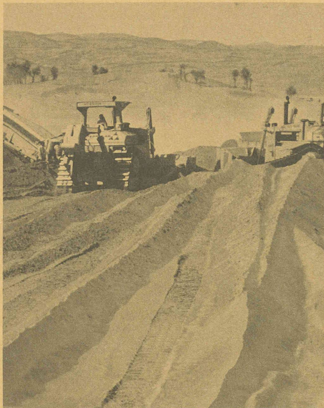
Pour la construction de l'aéroport de Al Ain à Abou Dhabi, qui exige le déplacement de 20 millions de m 3 de sable, la société CCC a notamment mis en service 54 machines Cat, dont une douzaine de tracteurs de la Série L. Ce D9L Cat, qui se reconnaît à son barbotin monté en position haute, développe une puissance nominale de 343 kW (460 HP).

nes à carburant ainsi que divers véhicules d'entretien et un chargeur Holland à bande transporteuse.