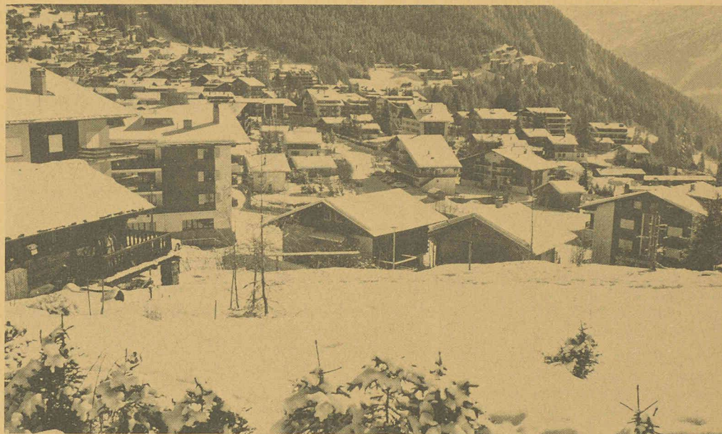
Rêves de neige poudreuse: l'aimant qui attire 25 000 visiteurs à Verbier.

Les premières ampoules brillent dans la vallée en 1903, mais également à Verbier lors de la mise en service de l'usine du Tombai. En 1933, pour répondre aux demandes des particuliers, le courant basse tension est amené dans des mayens du village. Cette installation se termine par un fameux bal, le 24 décembre. Ce n'est pourtant qu'à l'approche des années