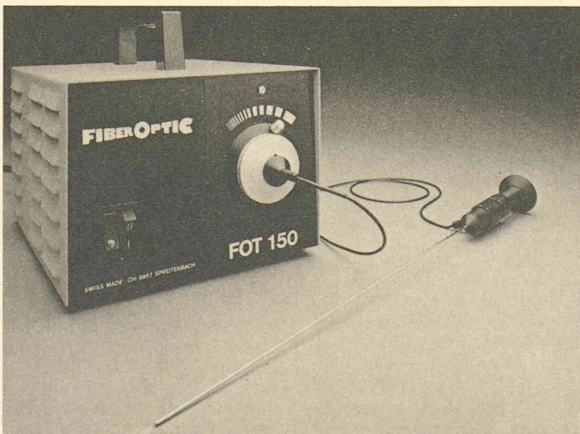
Avec un micro-endoscope de Fiber-Optic SA, livrable avec 5 diamètres de sonde compris entre 1,5 et 2,0 mm, on peut examiner avec précision les plus petites cavités.

cation des dispositifs de transmission d'images par fibres optiques, il est actuellement possible de construire des endoscopes avec des diamètres de sonde extrêmement réduits. Pour obtenir une résolution maximale, Fiber-