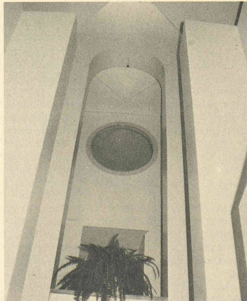
Maison particulière, Oberengstringen, 1986. (Architectes : Bétrix et Consolescia.)