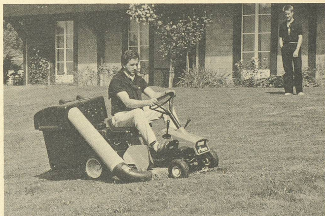
Le tondotracteur Ariens: le moyen le plus confortable de se mettre utilement au vert!

le petit modèle avec commande hydrostatique. Le programme vert-blanc se trouve chez les concessionnaires Aebi, dont le réseau serré en Suisse garantit un service après-vente bien organisé. Aebi & Co SA Fabrique de machines 3400 Berthoud Tél. 034/21 61 21