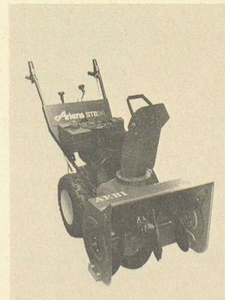
Trois modèles de turbofraises Aebi et quatre modèles Ariens: pour le blanc.

L'appareil à écran Cesophon est livrable en deux exécutions: station murale montée à demeure ou appareil de table mobile. Les teintes standards sont le blanc et le brun, d'autres peuvent être fournies sur demande. La station caméra de porte, également livrable en blanc et en brun, est extensible à volonté en système modulaire, d'une installation à un utilisateur aux grandes installations pour immeubles locatifs et commerciaux. Feller + Zingg GmbH 3173 Oberwangen Tél. 031/34 20 21