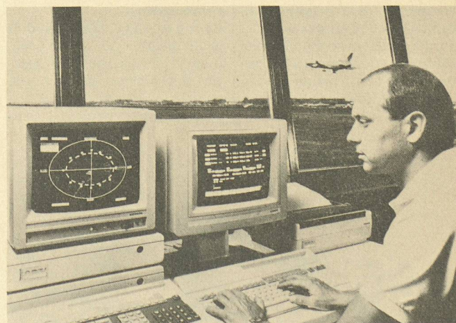
Le système météorologique pour aéroports Siport MET de Siemens assure la collecte automatique des données météorologiques, leur contrôle, leur calcul, leur traitement, leur diffusion et leur archivage. Il facilite la tâche du service météorologique et contribue à l'accroissement de la sécurité de la circulation aérienne.

Le système Siport MET remplace une multitude d'enregistreurs analogiques. Il est possible de récupérer immédiatement des données archivées. C'est ainsi qu'il suffit d'actionner la touche de fonction sur la console pour se faire afficher, en plus de la pression atmosphérique momentanée, la température de l'air de la journée précédente ou l'humidité de l'air à une date plus reculée. L'utilisateur peut compléter les messages par des commentaires, déclencher des signalisations en fonction de critères spécifiques de l'aéroport consi-