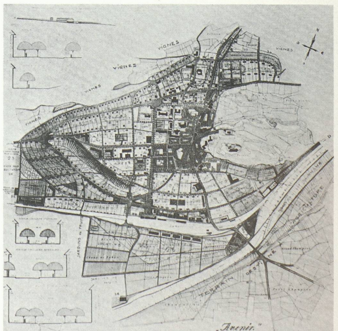
Sion au milieu des années vingt (à gauche) et telle que la voyait le lauréat du concours de 1927 (à droite).