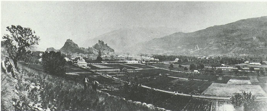
Sion au milieu du siècle dernier.