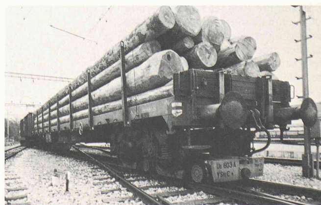
Bogies transporteurs Vevey sur Yverdon - Sainte-Croix : la rationalisation.