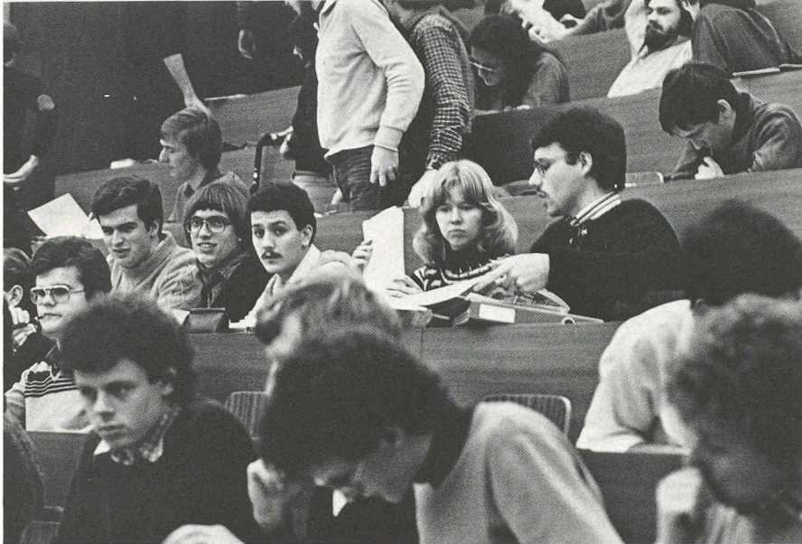
Les femmes aussi...

professionnel. Ce qui n'est pas toujours aisé au sein d'une famille.