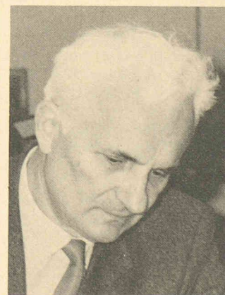
M. Jacques-Louis Lions.