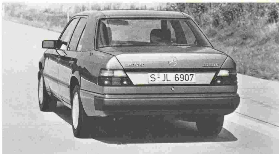
Fig. 1. - Doyen des fabricants de moteurs Diesel dans le monde entier, Mercedes-Benz poursuit la mise au point de moteurs à allumage spontané par compression, avec réduction des émissions nocives. Ici, un modèle de la gamme 190 D/300 TD Turbo.

elles soutiennent parfaitement la comparaison avec celles que produit un moteur à allumage par étincelle équipé d'un catalyseur régulé (à trois voies). Autre point sur lequel les fabricants vont devoir s'efforcer d'améliorer aussi le moteur Diesel: celui de ses émissions sonores. Selon un sondage réalisé en 1987 en République fédérale d'Allemagne, c'est la circulation routière qui est considérée comme la nuisance de bruit principale. Et plus de 9% des Allemands, c'est-à-dire plus de 5,5 millions de personnes, se sentent importunés par un niveau sonore trop