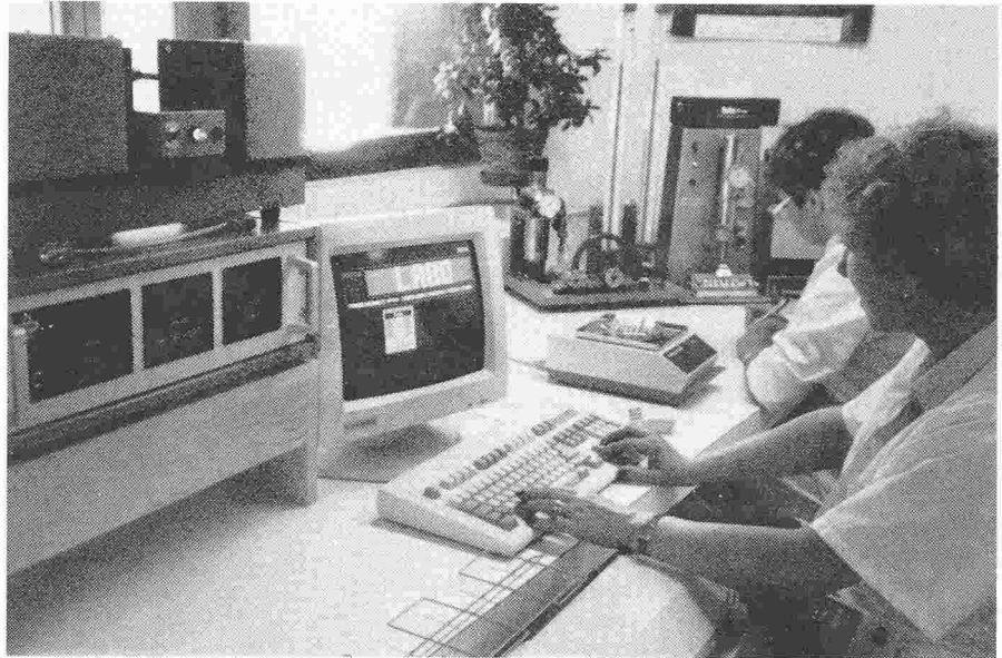
Fig. 1. - Vue d'ensemble de l'installation.

La figure 1 est une vue d'ensemble de l'installation, dont nous donnons ci-dessous les caractéristiques techniques :