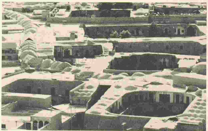
Isfahan, Iran: le Grand Bazar à la recherche de son chemin à travers les caravansérails, les mosquées et la structure urbaine.

Heures d'ouverture: du lundi au vendredi de 8 à 19 heures.