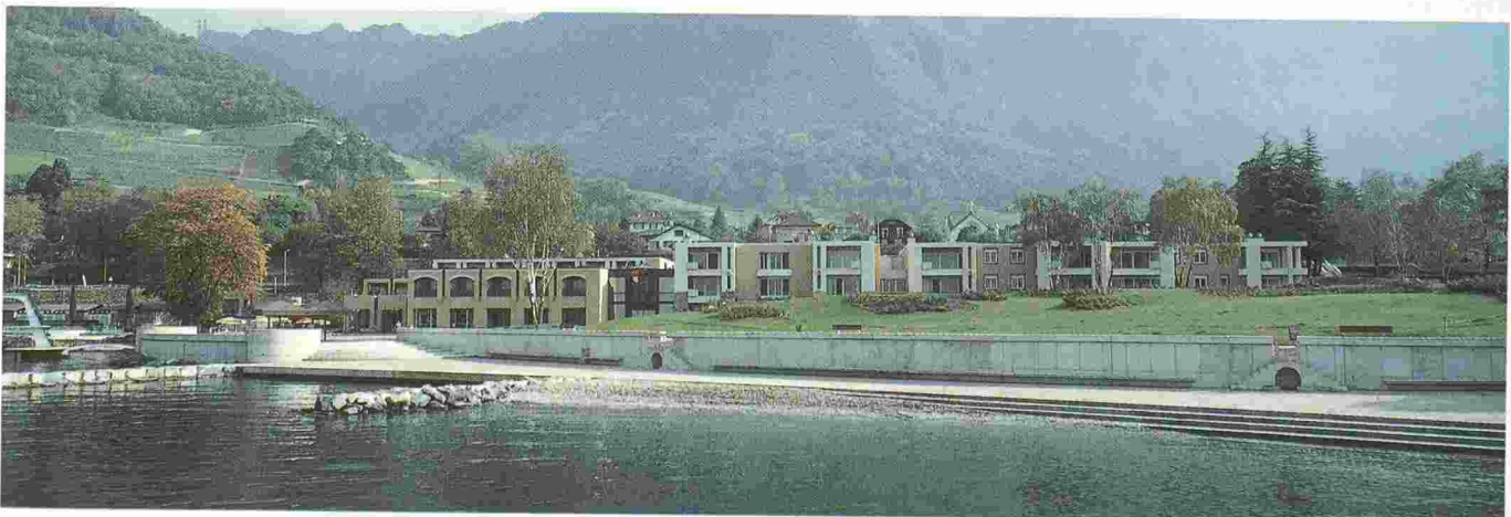
Les Marines de Villeneuve.

A Villeneuve, il y a onze ans, le projet de construire un important quartier résidentiel et de vacances directement sur les rives du Léman, à La Tinière, déclencha un mouvement d'opinion régional, puis national; certains craignaient en effet que ce paysage, d'une grande beauté, voisin du château de