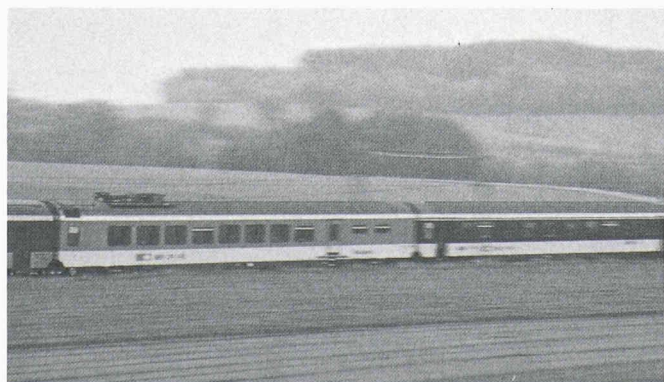
Parent riche: le train Intercity - Parent pauvre: le train régional.

Optimisme dépassé quant au trafic voyageurs? L'attrait exercé par les trains sur les foules est en grande partie dû aux services presque impeccables du chemin de fer suisse; Rail 2000 a pour but d'améliorer sensiblement cet optimum actuel en accroissant le nombre des trains et en réduisant les temps de parcours. Quant à la diminution de l'offre régionale que préconi-