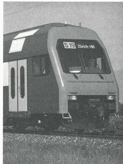
RER zuricois: démonstration de performance isolée ou image d'avenir des réseaux d'agglomération suisses ?

En réintroduisant dans leurs commentaires et leurs comparaisons les frais d'infrastructure des CFF, qui ont été sortis de leurs comptes, certains politiciens ou ceux qui soutiennent leur politique faussent les calculs et les commentaires qui en découlent.