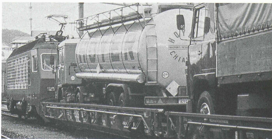
Un réseau ferré moderne et performant: un de nos rares atouts face à la Communauté européenne.