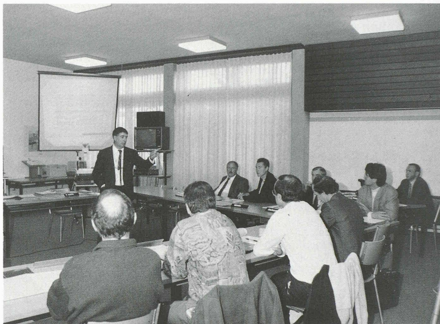
Salle de séminaire du centre de formation de la SSE, à Sursee.

Pour choisir un système CAO répondant à ses besoins spécifiques, l'utilisateur doit d'abord comprendre la différence entre systèmes bidimensionnels et systèmes tridimensionnels, et connaître leurs avantages et leurs inconvénients. En plus du choix d'un logiciel adéquat, le matériel utilisé joue un rôle important dans l'introduc-