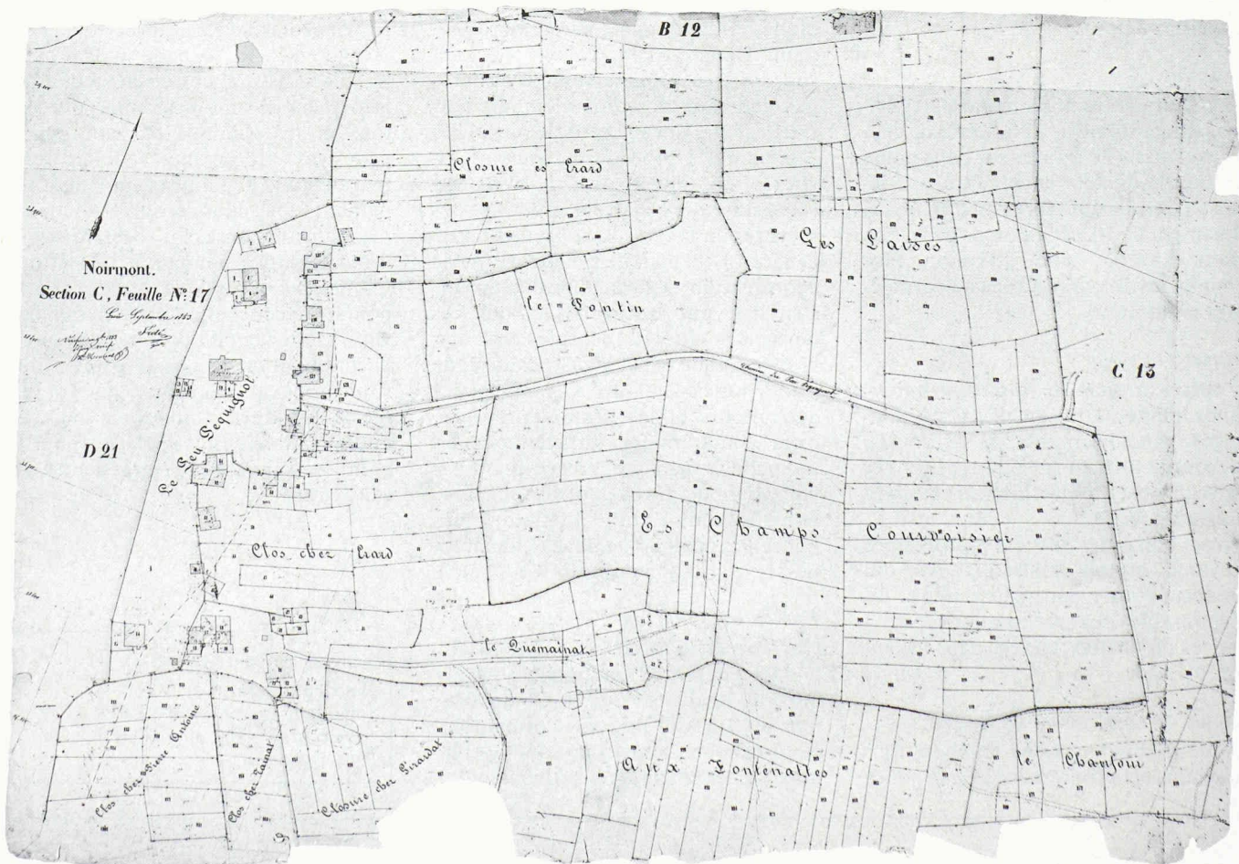
Fig. 1. - Le Noirmont : plan cadastral original de 1853.

L'échéance d'une nouvelle mensuration, là où une ancienne mensuration graphique existe déjà, est dictée essentiellement par la clause du besoin, soit