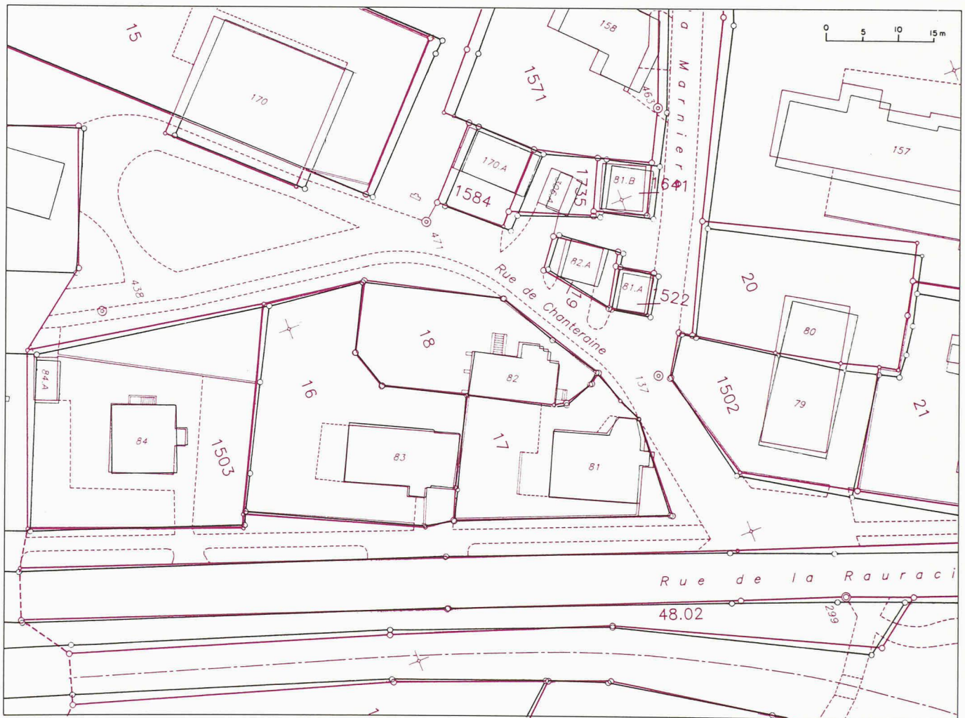
Fig. 4. - Le Noirmont : superposition d'un extrait du plan cadastral de 1938 (en noir) et de celui de 1991 (en rouge). Le plan de 1938 est une copie du plan de 1910, qui est lui-même une copie du plan original de 1853.

entraîner diverses difficultés, notamment pour :