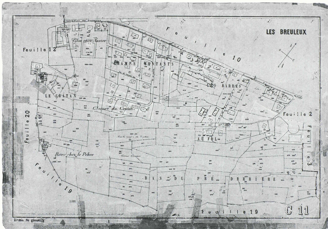
Fig. 2. – Les Breuleux: plan cadastral de 1900 (recopie), encore en vigueur aujourd'hui (ensemble et détail).