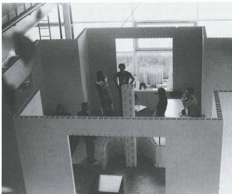
Le pied du mur: révélateur absolu d'un bâtir vrai