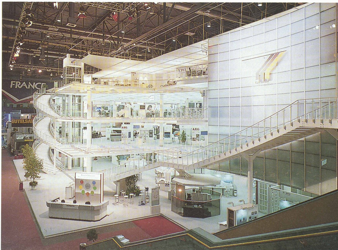
Le pavillon allemand: un palais de lumière.

Une exposition, c'est aussi, et pour le visiteur non spécialiste surtout, une expérience visuelle, un espace amé-