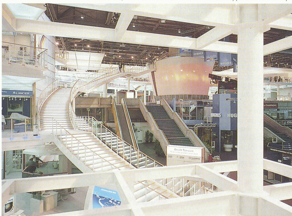
Le pavillon allemand: échappée.

La nouvelle loi suisse sur les télécommunications (LTC), qui est entrée en vigueur le 1 er mai 1992, est conforme aux directives de la Communauté européenne. Elle limite les domaines du monopole des PTT qu'elle expose aux défis de la libre concurrence. La nouvelle loi établit en effet une différence entre le service de base qui reste du domaine des PTT et les services élargis qui sont ouverts à la libre concurrence. Dans la première catégorie entrent la téléphonie, la transmission et la commutation des informations, sans toutefois le traitement de ces dernières qui entre dans la seconde catégorie. Les possibilités d'action du secteur privé se trouvent élargies, la concurrence est accrue et les choix du consommateur deviennent plus difficiles. La création d'un Office fédéral de la communication permet de séparer les tâches de réglementation et d'exploitation. Dans ce nouveau contexte, les PTT suisses vouent une grande attention au développement des réseaux à valeur ajoutée (VAN: Value Added Networks) et des réseaux privés (PNS: Private Network Services). Afin d'assurer leur présence outre-mer, les PTT ont ouvert, en 1990, un bureau «Swiss Telecom North America» à Washington D.C. A Télécom 91, les PTT suisses présen-