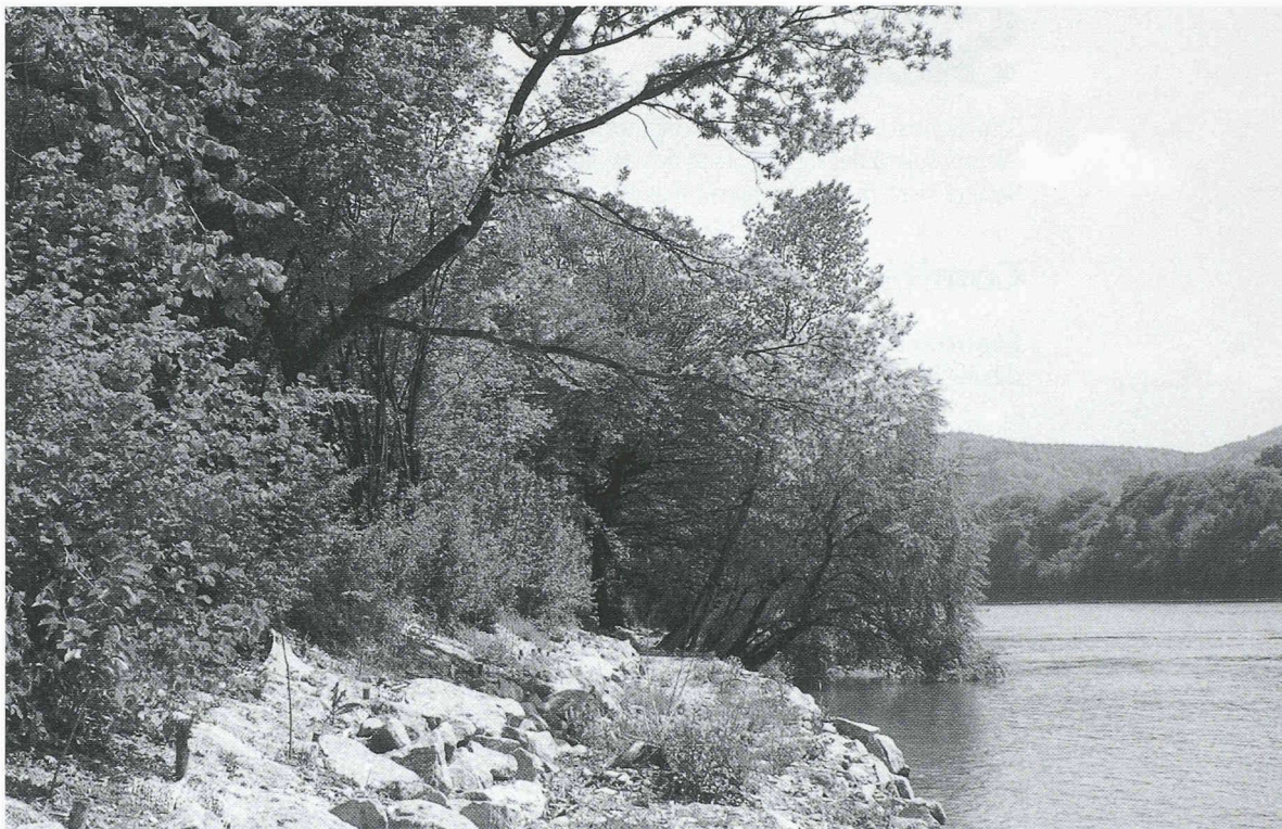
Un aménagement biologique des rives par des spécialistes, ainsi que l'application de plans d'entretien permettent de revaloriser un paysage.

section exploitation forestière, groupe régional de planification de la vallée supérieure du Fricktal). La mise en application des plans d'entretien a déjà débuté et durera au-delà de l'an 2000.