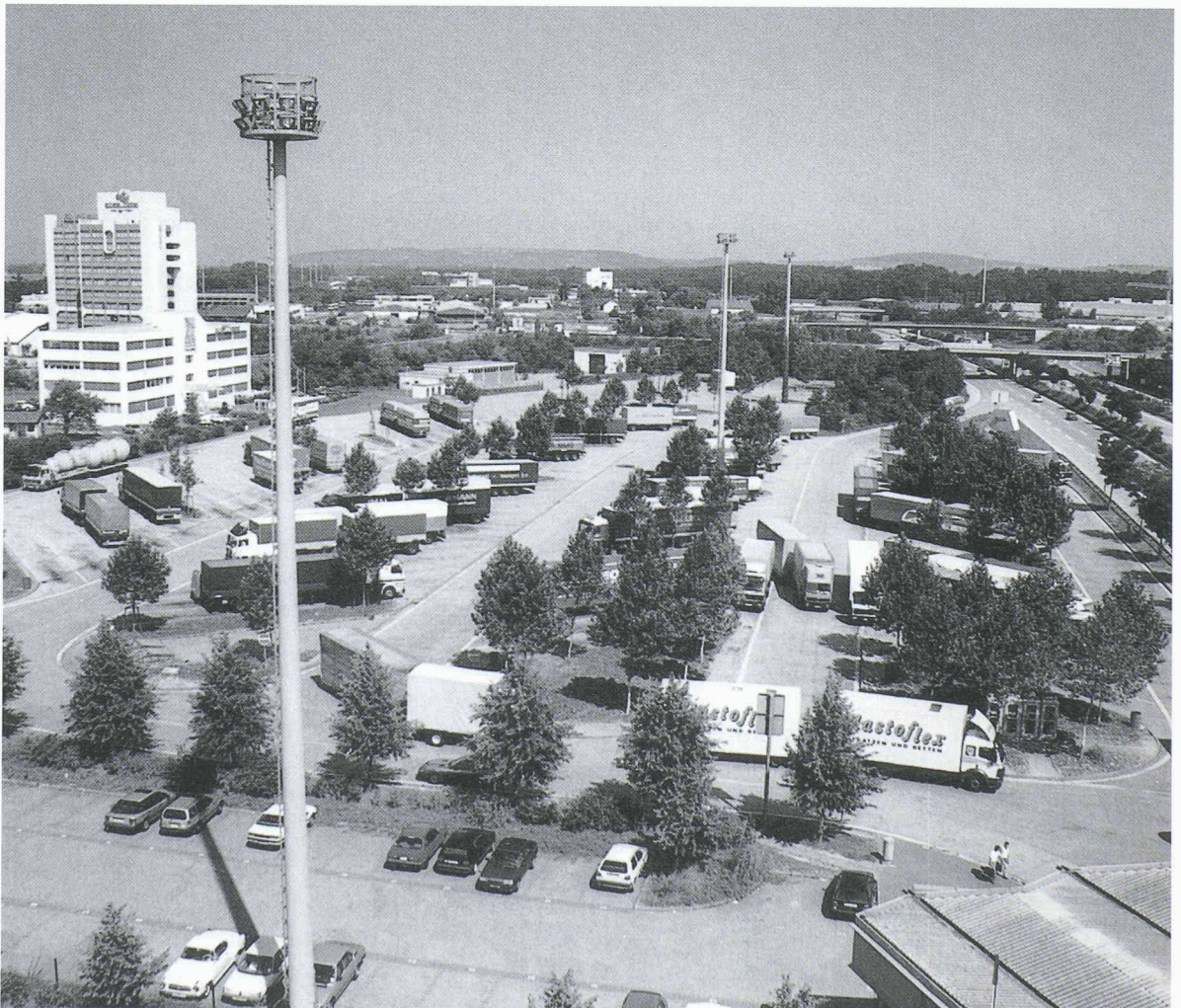
Dans l'aire douanière commune, plus de 300 transports de matières dangereuses sont recensés chaque jour. Des mesures appropriées contribuent à augmenter la sécurité.