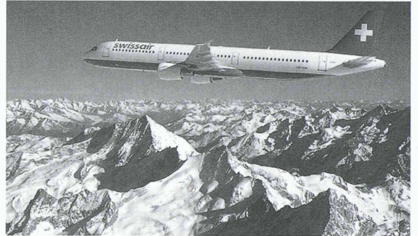
L'Airbus A321, le plus grand de la famille avec ses 176 sièges

1 La procédure d'enquête française – qui n'était pas faite pour dissiper tout soupçon quant à son absolue indépendance par rapport au constructeur – n'a en rien contribué à calmer vraiment les esprits.