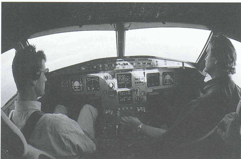
Le cockpit de l'Airbus A321 (identique à celui de l'A319 et de l'A320). Sur le tableau de bord, six écrans cathodiques remplacent les multiples instruments circulaires des avions des générations précédentes. Plus de volants, mais deux mini-manches le long des parois latérales. On distingue celui de droite, dans la main droite du copilote.