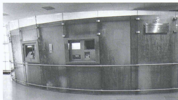
Nouveaux guichets de la BCV au Palais de Beaulieu (architecte: R. Mosimann)

Réalisé par Roland Mosimann, architecte SIA, le pavillon consacré à l'exposition spéciale intitulée «L'Art du Verre» occupera quelque 600 m 2 de la halle 7 du bâtiment principal. Développée à partir d'un socle carré accessible par quatre rampes latérales, la présentation joue sur les trois dimensions: à la hauteur du visiteur par le biais d'objets, diapositives et autres animations, dans la toiture par des éléments suspendus comme des verres collés de façades, et dans le socle avec des objets encastrés et des dalles en verre. Conçue dans une perspective didactique, cette exposition retracera l'histoire du verre à travers les différentes méthodes de fabrication, dont le procédé semble avoir atteint de nos jours son degré de perfection. Machines, panneaux explicatifs et photos permettront aux visiteurs de se familiariser avec les caractéristiques et les propriétés physiques, statiques et optiques de ce matériau. Dans la vaste gamme des applications possibles, l'architecture et l'habitat auront la part belle avec leurs fenêtres, portes, briques de verre, verres isolants, trempés ou armés, lampes, tables, vases, miroirs et autres emballages. L'art sera également présent au travers de créations, de sérigraphies, de démonstrations de souffleurs de verre et d'artisans travaillant selon la méthode brevetée Tiffany . Enfin, sujet préoccupant