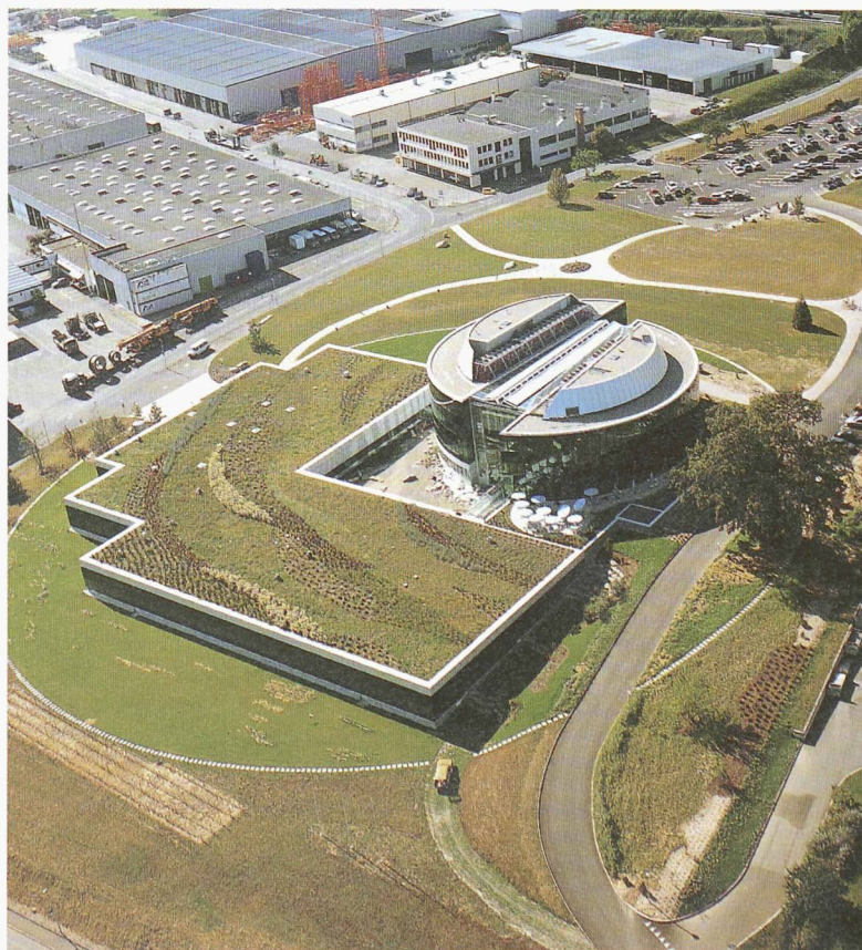
Vue aérienne du site: le bâtiment de production au premier plan, le bâtiment administratif, et les zones de parcage au nord de la parcelle

Avec le bâtiment administratif, livré au mois de juillet dernier, 175 personnes ont été engagées sur le site de Tolochenaz en 22 mois. La création d'un centre de recherche d'ici la fin de l'année portera ce chiffre à 200, dans un proche avenir. Les nouvelles volées d'ingénieurs devraient d'ailleurs pouvoir en profiter.