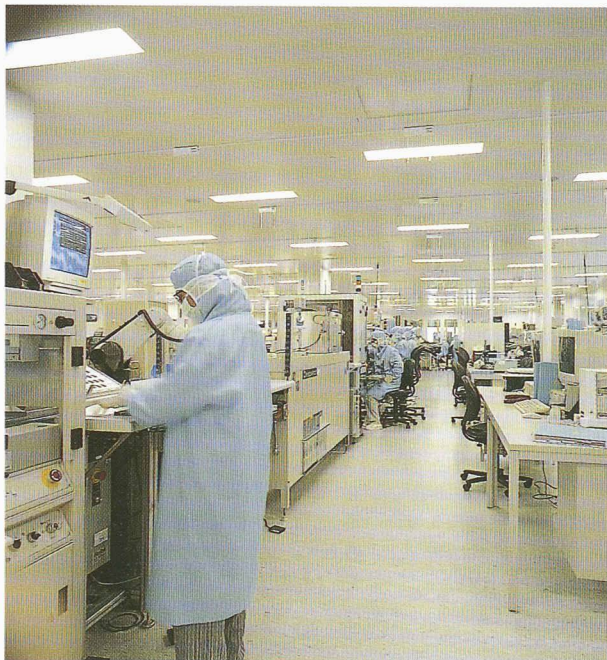
Les lignes de production en fonction, à l'intérieur de la salle blanche

consommation d'énergie. Un des projets prioritaires, réalisé avec l'entreprise Debiotech , consiste à concevoir une pompe de faibles dimensions, entièrement implantable, pour la diffusion de médicaments. A ce degré de miniaturisation, les technologies utilisées n'ont plus rien à voir avec l'ingénierie classique: on pénètre dans le domaine de la biotechnologie, des membranes perméables et des phénomènes piézo-électriques (propriété qu'ont certains cristaux de se déformer sous l'action d'un champ électrique).