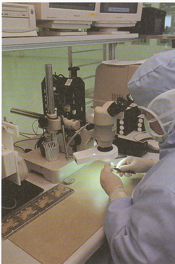
L'électronique destinée aux stimulateurs cardiaques est encapsulée dans une boîte en titane et soudée au laser

cardiaque peut être programmé pour chaque patient: cette opération s'effectue à distance, par ondes radio, de même que la lecture d'informations concernant le patient et son électrocardiogramme, recueillies dans le pacemaker. Le système est évolutif. Auparavant, le stimulateur cardiaque ou le défibrillateur sauvait la vie du patient, maintenant il améliore plutôt la qualité de vie d'un nombre important de personnes souffrant de pathologies mineures ou dépendant entièrement d'une assistance cardiaque.