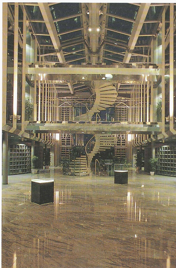
Le hall d'entrée illuminé

secteur ouest du bâtiment administratif. Il est en prolongement direct du hall d'accueil et de la réception. Il comprend :