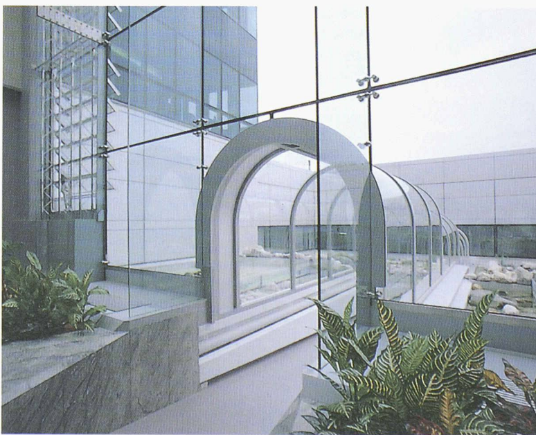
Couloir pour la circulation entre le bâtiment administratif et la production