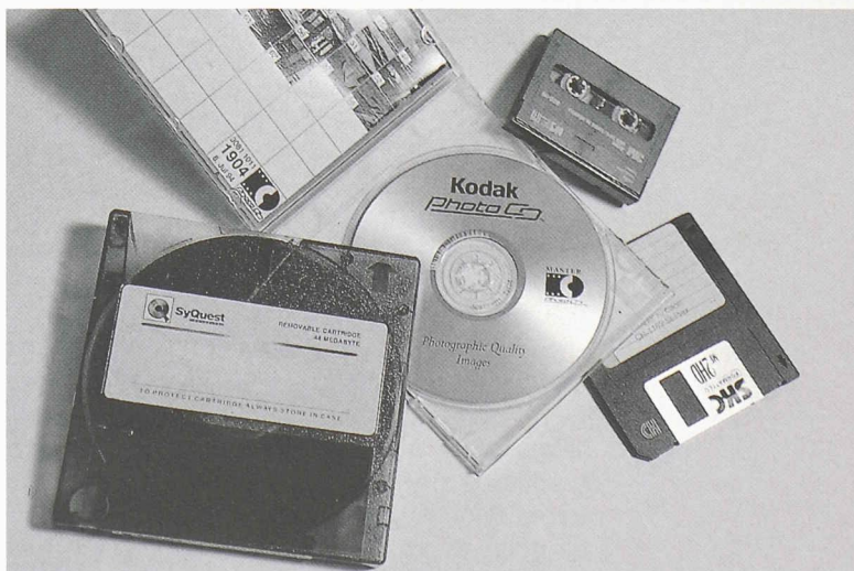
Fig. 2.- Supports informatiques: un vide documentaire sans précédent. Aucun support de stockage de données numériques ne garantit la pérennité physique des matières dont il est constitué, pas davantage que la durée au cours de laquelle les données y demeurent inscrites... L'accès aux informations contenues sur ces supports nécessite une médiation instrumentale dont personne ne peut garantir qu'elle sera disponible dans cinq ou dans cinquante ans.