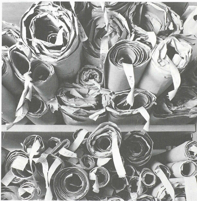
Fig. 3.- Tout garder, compris comme une sorte « d'option par défaut », revient le plus souvent à se résigner à tout perdre, sans en être vraiment conscient. L'élimination raisonnée procure aux fonds d'archives constitués la crédibilité qui justifie leur conservation.

durs, cartouches en tous genres, bandes magnétiques, vidéodisques, CD-Rom etc. ne doivent en aucun cas être considérés comme des supports d'archivage durables, sous peine de disparition pure, simple et certaine des données. Il faut démentir avec véhémence la propagande de fournisseurs qui prétendent que ces arguments appartiennent à un passé révolu. Le rythme de l'innovation technologique et les conditions des marchés des produits industriels informatiques ne donnent, pour le moment, aucun signe qui puisse laisser croire à l'émergence d'un produit de stockage fiable à long terme pour de grandes quantités de données digitales. Au surplus, la promesse de durées de vie plus longues de ces matériels ne change rien à l'affaire, leur principal défaut étant d'être opaques et de nécessiter une médiation instrumentale, relevant d'une très