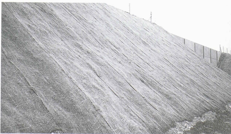
alpavert SA, au Village, 1628 Vuadens Tél.: 026/913 75 40, fax 026/913 75 41

Citons en particulier le système antiérosion HASTECH qui offre aux maîtres d'ouvrages et ingénieurs des réponses résistantes et durables à des problèmes spécifiques. L'assortiment comprend un choix très large de nattes en fibres naturelles (jute et coco) dans des grammages et des dimensions très variés, qui peuvent s'appliquer tant à la correction de rivière, que sur des pistes de ski ou, encore, pour la revégétalisation naturelle avec des espèces indigènes (photo).