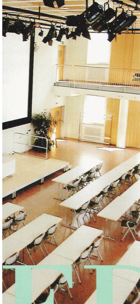
L'auditorium de l'ETMN: une technique ultramoderne de 300 places. Entrepreneur général: Alfred Müller AG. Architecte: NCL, La Chaux-de-Fonds.