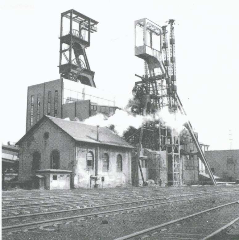
Des volumes et des architectures inattendus. Ici les puits Wendel à Petite-Rosselle.