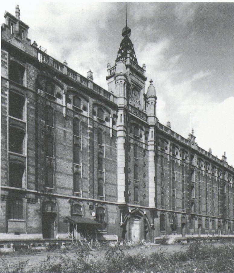
L'architecture a cautionné la nouvelle civilisation industrielle en affichant des images de marque concluantes. Ici: l'entrepôt de Tour et Taxis, Bruxelles, façade Est.

Quant à l'appellation « archéologie industrielle », si elle peut a priori paraître antinomique - archéologie renvoyant traditionnellement à la recherche et aux fouilles concernant une civilisation enfouie et disparue, alors qu' industrielle s'applique au