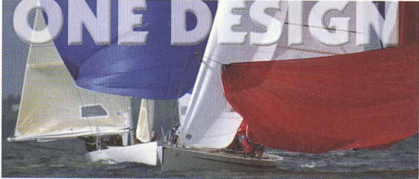
Développement pour les classes monotypes suisses et distribution des voiles les plus titrées en séries internationales.

La souplesse d'une PME La force d'un grand groupe