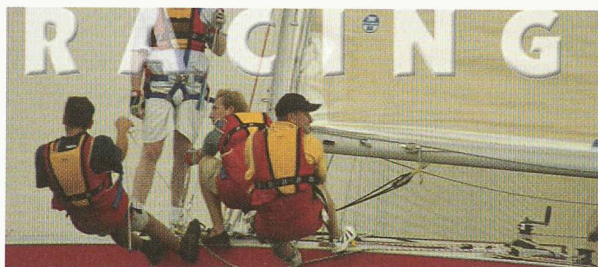
Des victoires dans toutes les classes ACVL.

Mise sous format informatique de la forme des pièces