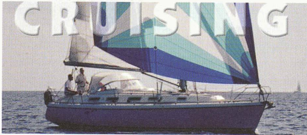
En mer ou sur nos lacs, nous réalisons des voiles de croisière pour toutes les tailles de bateau.