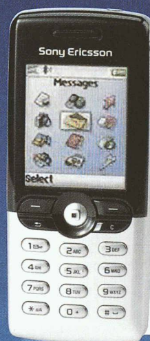
Sony Ericsson T610

Profitez! Dès maintenant dans tous les Swisscom Shops ou chez votre revendeur spécialisé. Offre valable jusqu'au 31.12.2003.