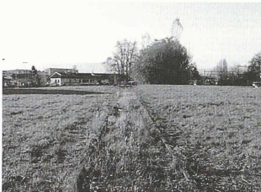
Fig. 1 : Site de Malley à Lausanne