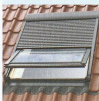
Volets roulants extérieurs