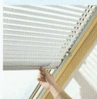
Stores à lamelles