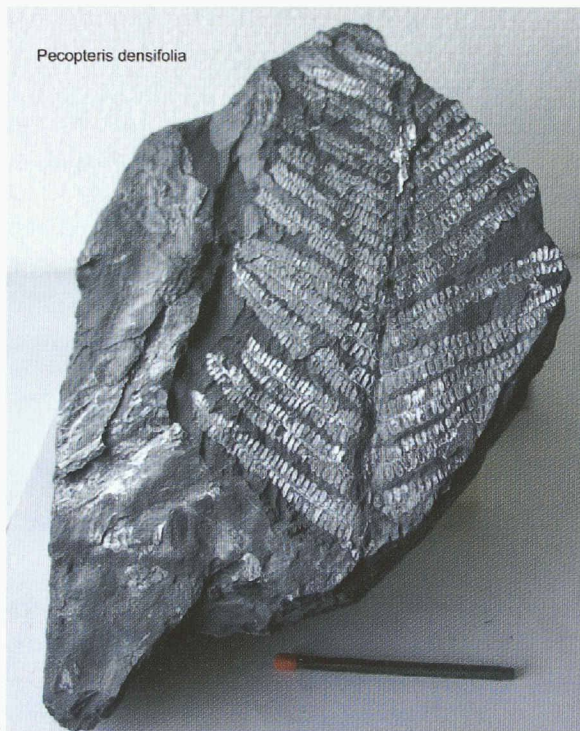
Fig. 2 : Fougère fossile