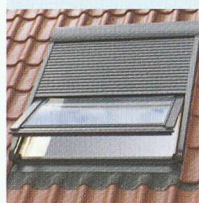
Volets roulants extérieurs