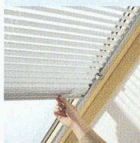
Stores à lamelles