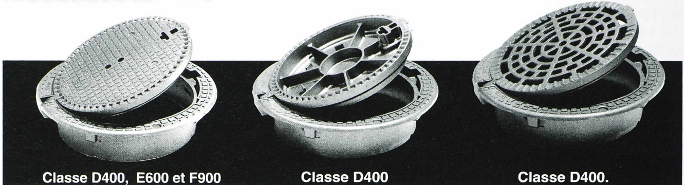
Classe D400, E600 et F900 avec ou sans verrouillage (ventilé ou non en D400).