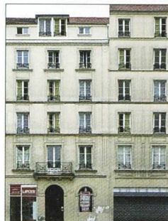
Immeuble avec laverie, rue Bichat, à Paris