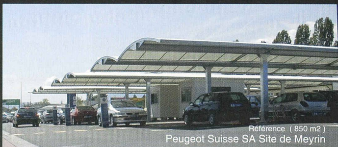
Référence ( 850 m 2 ) Peugeot Suisse SA Site de Meyrin