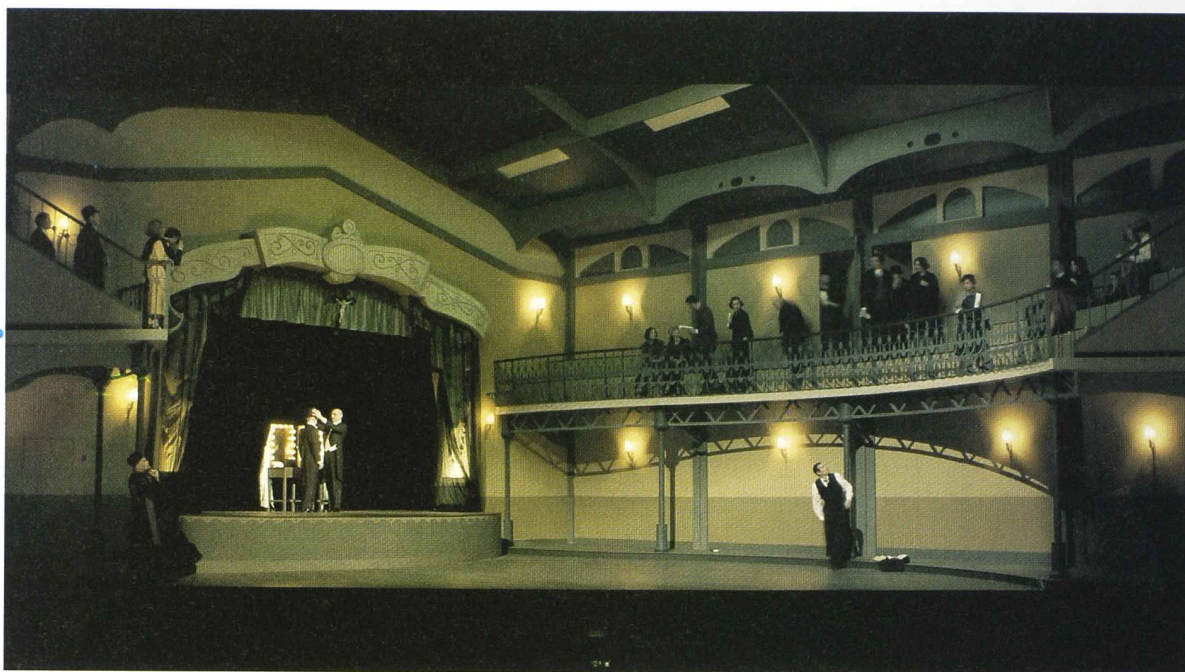
Fig. 3 : « Lady Macbeth de Mzensk » de Dmitri Chostakovitch, mise en scène André Engel, lumières André Diot (1992). Un espace immense éclairé avec parcimonie

Fig. 2 : « K... », opéra de Philippe Manoury d'après « Le procès » de Franz Kafka. Mise en scène André Engel, lumières André Diot (2001)