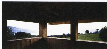
Vue depuis le pavillon de thé de la maison du Mont-Pèlerin

La chambre claire, Maison K+N à Wollerau Francesco Della Casa