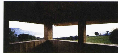
Vue depuis le pavillon de thé de la maison du Mont-Pèlerin

La chambre claire, Maison K+N à Wollerau Francesco Della Casa