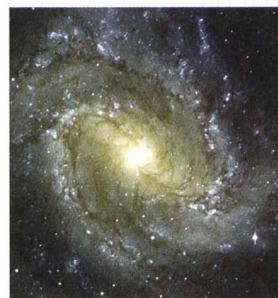
Centre de la galaxie spirale « Messier 83 », novembre 1999 (European Southern Observatory-ESO)

Une nouvelle stratégie pour observer des trous noirs Frédéric Courbin, Pascale Jablonka et Georges Meylan