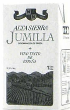
Alta Sierra Jumilla