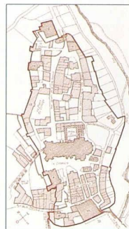
Plan du quartier de la Cité, à Lausanne, au Moyen Âge (Document lié de l'ouvrage "Les monuments de l'art et d'histoire du Canton de Vaud", tome II, Editions Birkhäuser, Bâle, 1944)

Histoire d'un projet Francesco Della Casa